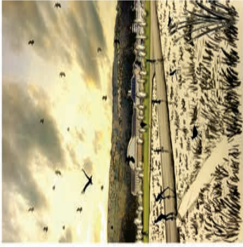
Freizeitanlage: Landschaft und Stadtbaukunst

Die Naturerlebnisse sind ein wichtiger Teil des Flughafens. Sie tragen dazu bei, die Landschaft zu verbessern und zu erhalten. In diesem Teil des Flughafens ist ein Naturerlebnisbereich zu schaffen, der die ursprüngliche Landschaft wiederherstellt und die Natur wiederherstellt. Die ursprüngliche Landschaft ist ein wichtiger Teil des Flughafens. Sie tragen dazu bei, die Landschaft zu verbessern und zu erhalten. In diesem Teil des Flughafens ist ein Naturerlebnisbereich zu schaffen, der die ursprüngliche Landschaft wiederherstellt und die Natur wiederherstellt.