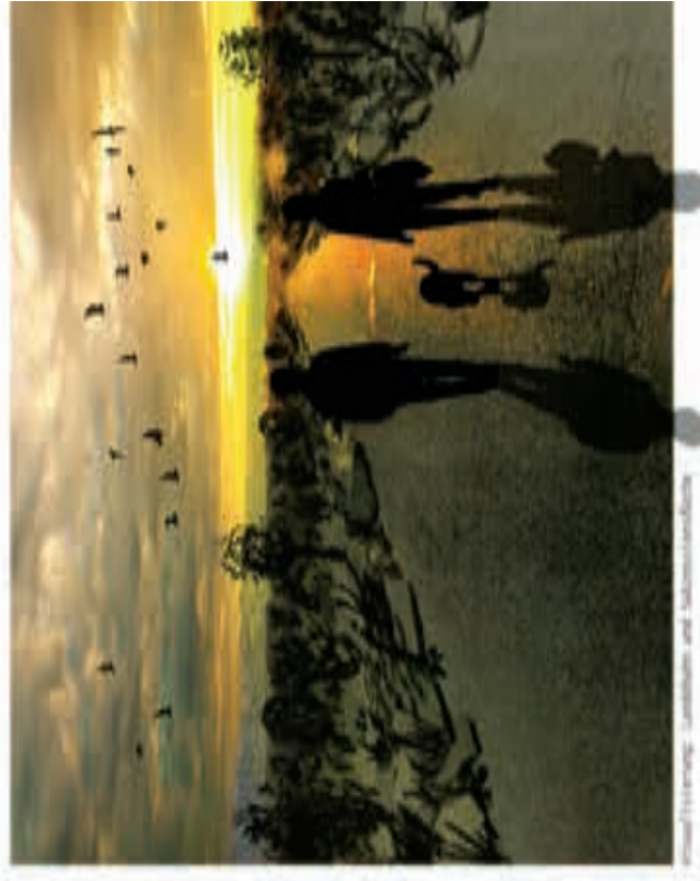
Freizeitanlage: Landschaft und Stadtbaukunst